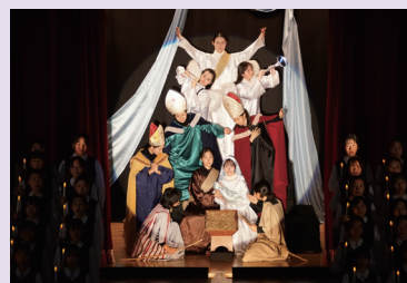
クリスマス・ウィッシング クリスマス・キャロル(公開)