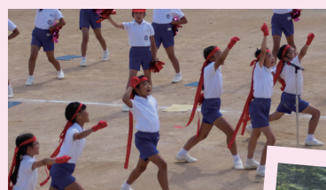
Stage I 運動会(公開)