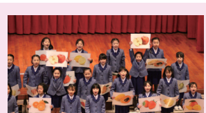
小学校英語発表会