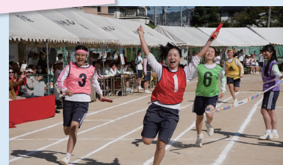
Stage III 体育祭(公開)